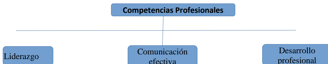
Figura 1. Competencias profesionales.