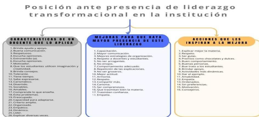
Figura 2. Análisis de información del instrumento 3. Muestra estudiantes. Elaboración propia